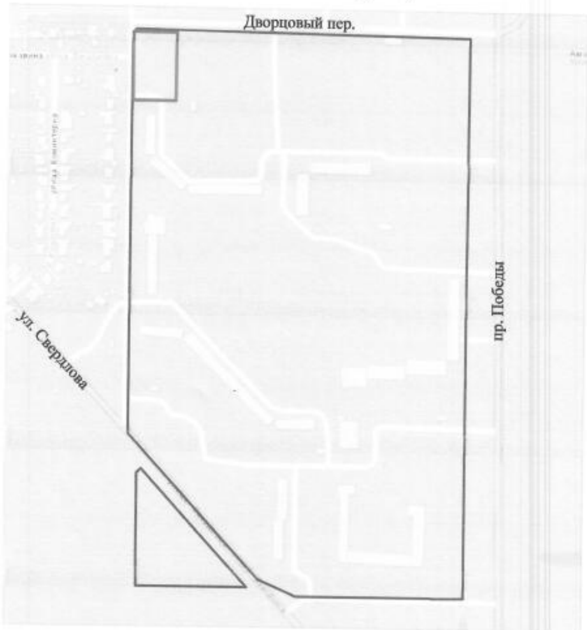
Схема расположения территории